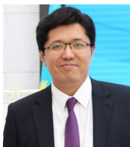
ЕРЖАН САЛТЫБАЕВ Казахстан

Президент Института политических и международных исследований, заместитель министра иностранных дел Ирана