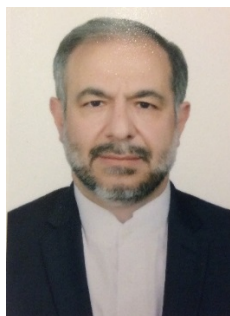
СЕЙЕД РАСУЛ МУСАВИ