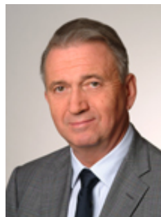
ТЕРЬЕ РОД-ЛАРСЕН Норвегия

Директор направления по исследованиям проблем международной безопасности Royal United Services Institute for Defence and Security Studies