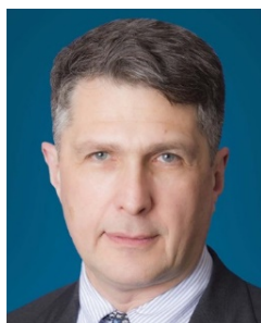
ЮДЖИН РУМЕР США

Директор программы изучения России и Евразии Carnegie Endowment for International Peace