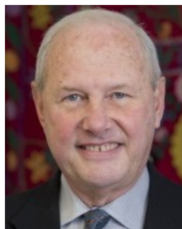
ФРЕДЕРИК СТАРР США

Директор Института мировой экономики и политики при Фонде Первого Президента Республики Казахстан – Лидера Нации